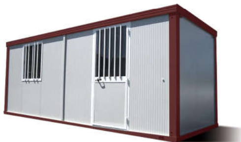
BUNGALOW DE CHANTIER STANDARD MODÈLE 609 / 242 CM OPTION COULEUR