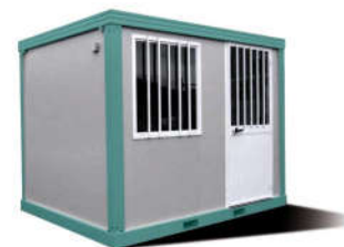
BUNGALOW DE CHANTIER STANDARD MODÈLE 309 / 242 CM OPTION COULEUR