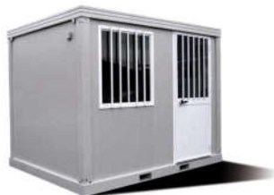
BUNGALOW DE CHANTIER STANDARD MODÈLE 309 / 242 CM SANS OPTION